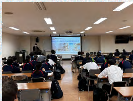
高校生への講演会の様子 プロジェクトリーダーとして概要説明